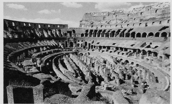
Coliseu: parte da construção foi destruída por terremotos.

Dados publicados em DUARTE, Marcelo. O guia dos curiosos. 2. ed. revista e atualizada. São Paulo: Companhia das Letras, 2001.